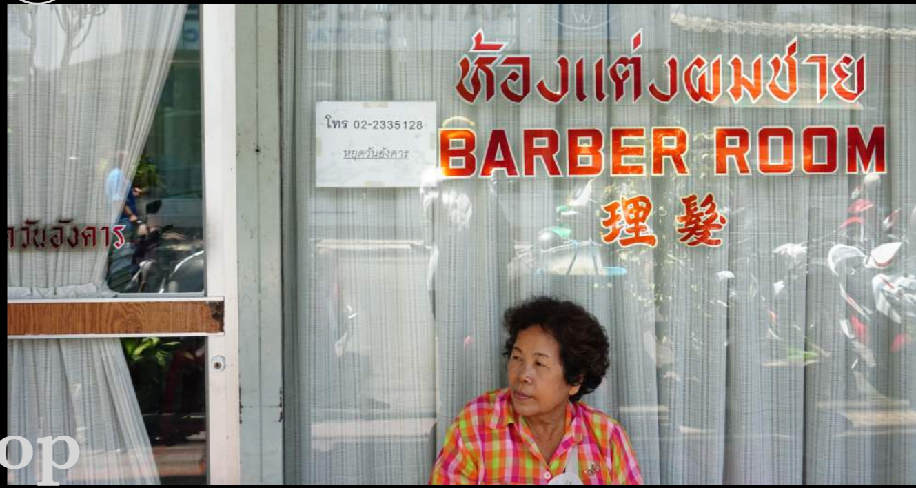
@ร้านจันทร์เพ็ญChanpen Shop