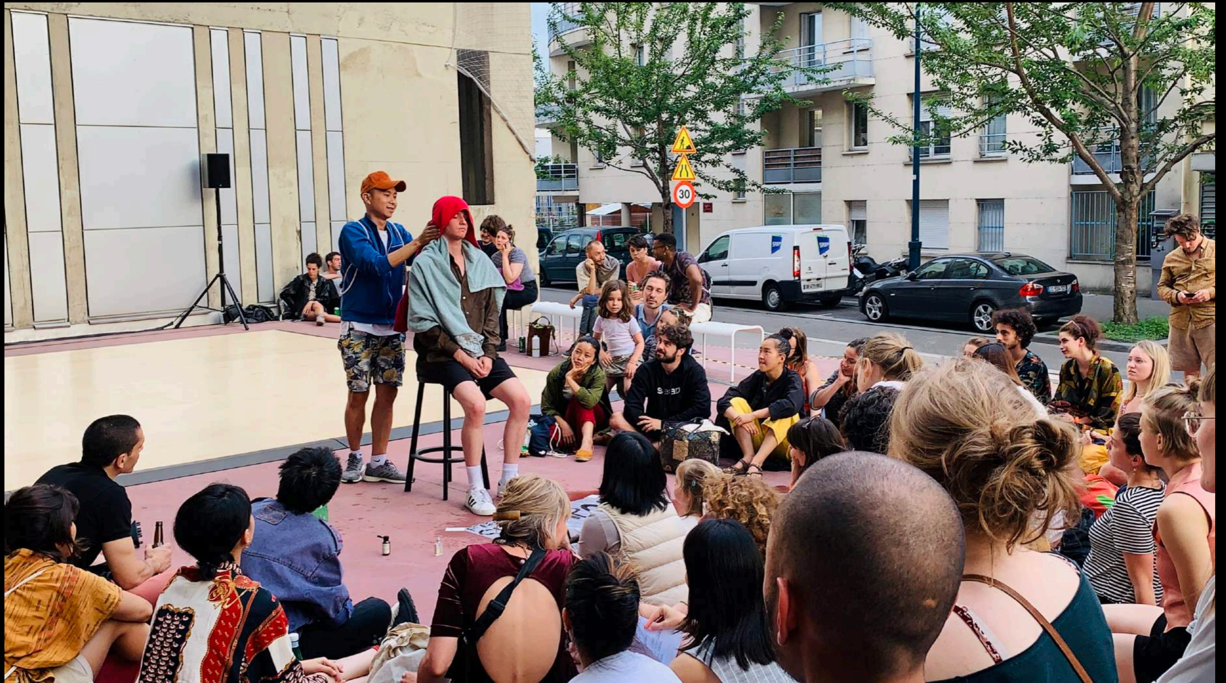
School Marathon, CND 2019 Camping, Paris